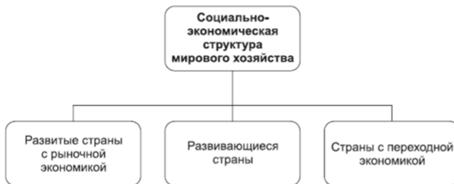
Рис.3. Структура мирового хозяйства

Мировая экономика (МЭ) – это сложная, неоднородная экономическая структура, в составе которой выделяют: субъекты, объекты и механизм мирохозяйственных связей.