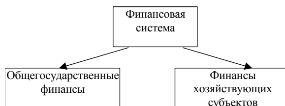
Рис.2. Финансовая систему государства

Финансы представляют собой экономический инструмент распределения и перераспределения валового внутреннего продукта, орудие контроля за образованием и использованием фондов денежных средств. Совокупность финансовых отношений в рамках национальной экономики образует финансовую систему государства. Ее структура показана на схеме: